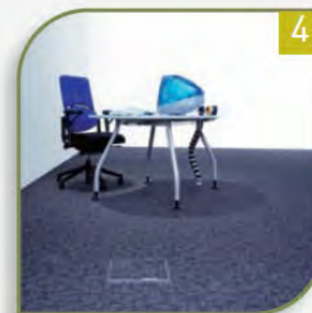
4 Belag mit Teppichplatten..