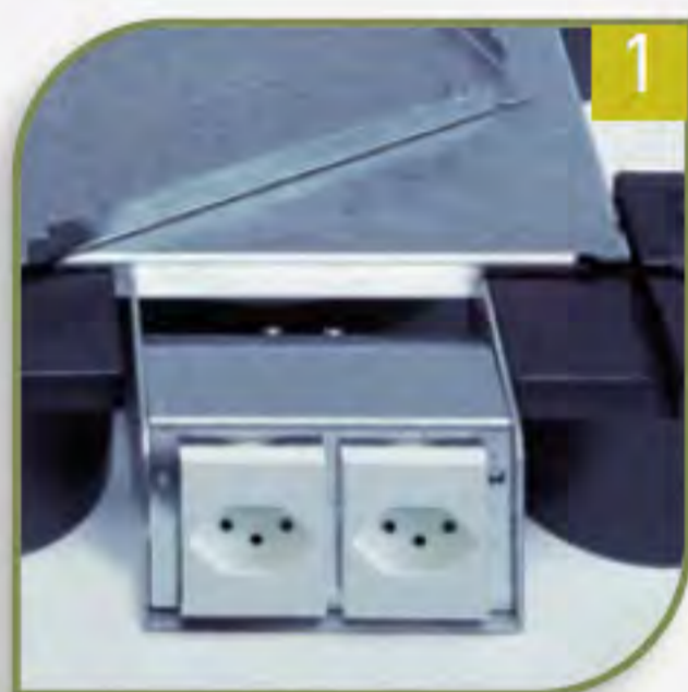
1 Daten- und Stromanschlüsse, genau da wo benötigt.

Wie so etwas möglich ist? Wir würden uns freuen, Ihnen mehr darüber erzählen zu dürfen.