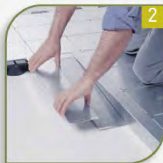
2 Für eine perfekte Einrichtung steht Ihnen vielfältiges Zubehör zur Verfügung.