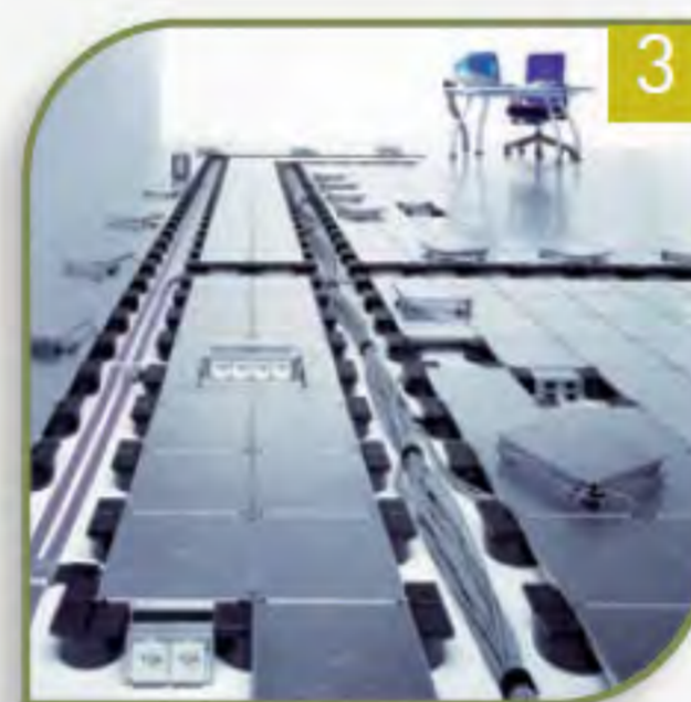
3 Das ganze ohne Kleber und Verschraubung. Die Platte wird einfach in die Stütze eingeklickt.