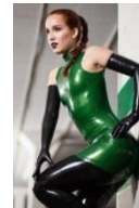
Latex & Co