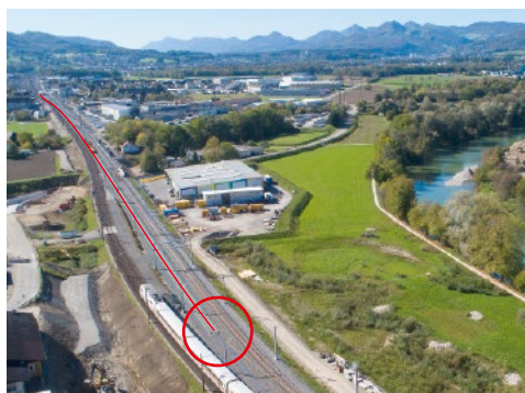
7. Oktober 2017: Der Zug verkehrt über das alte Gleis, das neue Gleis liegt für den Anschluss an die Stammlinie bereit.

Am ersten Oktober-Wochenende hat das Projekt einen wichtigen Meilenstein erreicht: das dritte Gleis wurde an die Stammstrecke angeschlossen. Damit ist die zweispurige Stammstrecke fertig und an der endgültigen Lage. Nun wird die zweispurige Tunnelzufahrt vorbereitet.