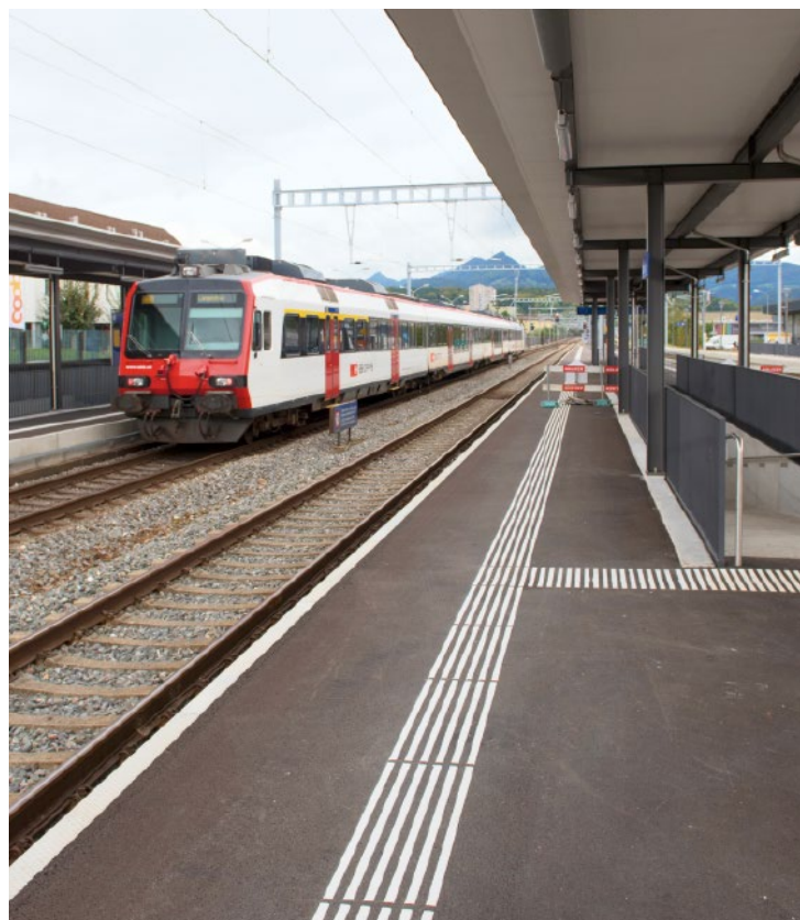
Stufenfreies Perron am Bahnhof Dulliken.

Anstelle des alten Bahnhofsgebäudes hat die SBB ein neues Aussenperron erstellt, über das die Reisenden seit Herbst 2016 stufenfrei in die Unterführung gelangen. Im Herbst 2017 gingen auch die bestehenden, umgebauten Perrons in Betrieb. Diese haben nun eine Rampe anstelle einer Treppe sowie ein neues Dach, damit die Reisenden vor Wetter geschützt ein- und aussteigen können. Gleichzeitig sind die bestehenden Lärmschutzwände zum Schutz der Anwohner erhöht und neue überdachte Veloständer gebaut worden.