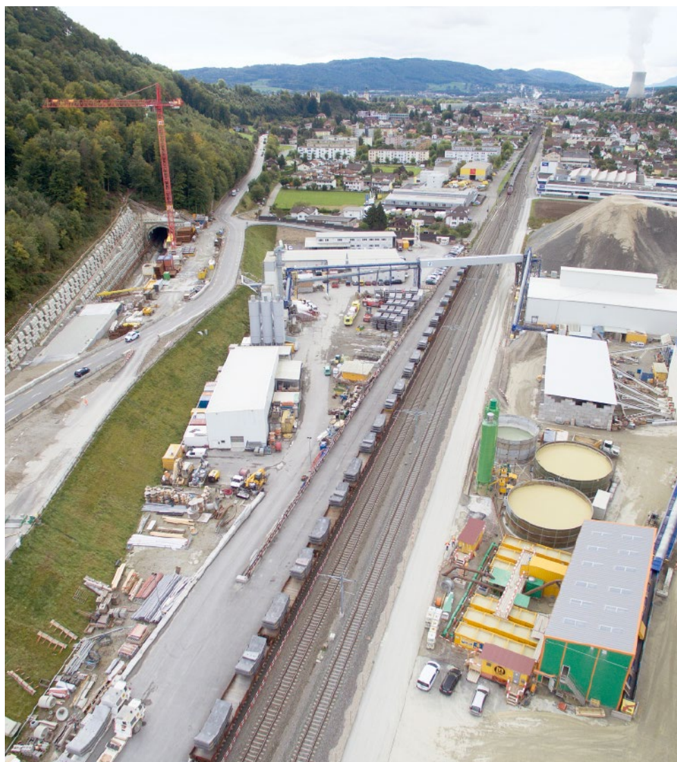
Blick auf das Tunnelportal Wöschnau in Richtung Olten.