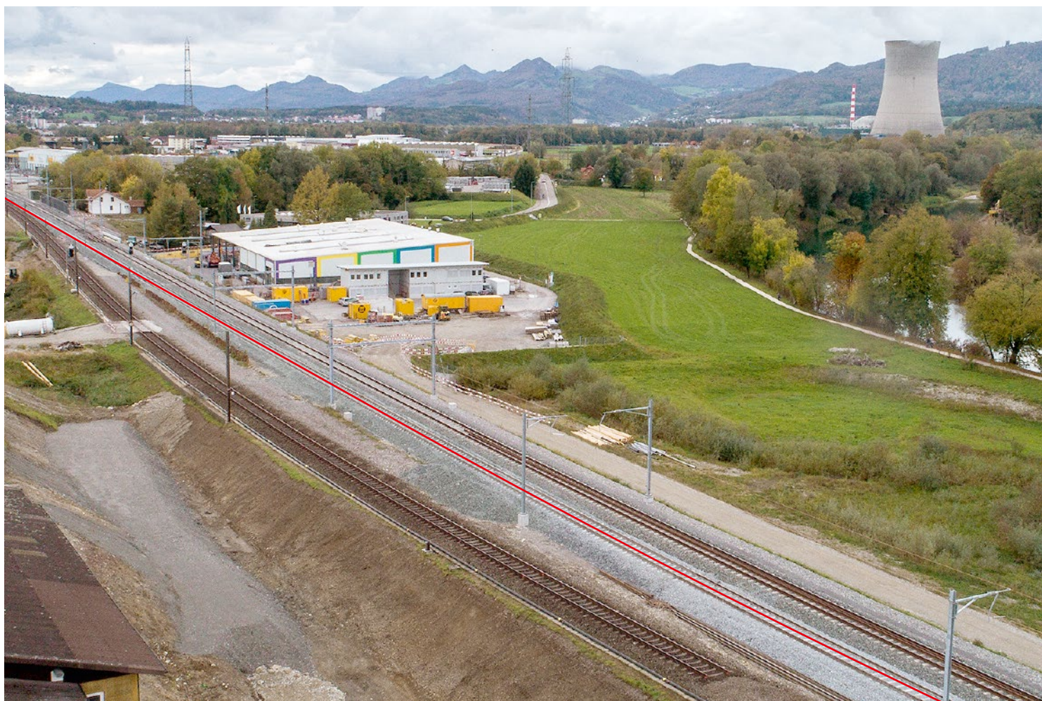
9. Oktober 2017: Neues Gleis an die Stammlinie angeschlossen, das Gleis links im Bild wird zurückgebaut, damit die zweispurige Zufahrt zum Eppenbergtunnel gebaut werden kann.

Gretzenbach abgebrochen, damit das Trasse für die Zufahrt zum neuen Eppenbergtunnel erstellt werden kann. Voraussichtlich im April 2018 wird die verbreiterte Strassenunterführung Güterstrasse fertiggestellt und die Rampe angeschlossen. Sobald der Innenausbau des Tunnels gemacht wird, verlegt das Bauteam auch die neuen Gleise über die Unterführung Güterstrasse.