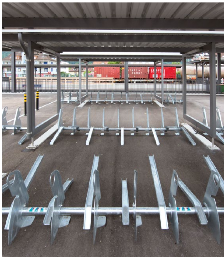
Neue Veloständer am Bahnhof Dulliken.

Mit dem Vierspurausbau Olten–Aarau führen die beiden südlichen Gleise ab 2020 durch den Eppenbergtunnel. Die Regionalzüge müssen folglich auf den nördlichen Gleisen verkehren. Dafür wurden in Dulliken und Däniken neue Perrons auf der Nordseite gebaut und die bestehenden Perrons modernisiert.