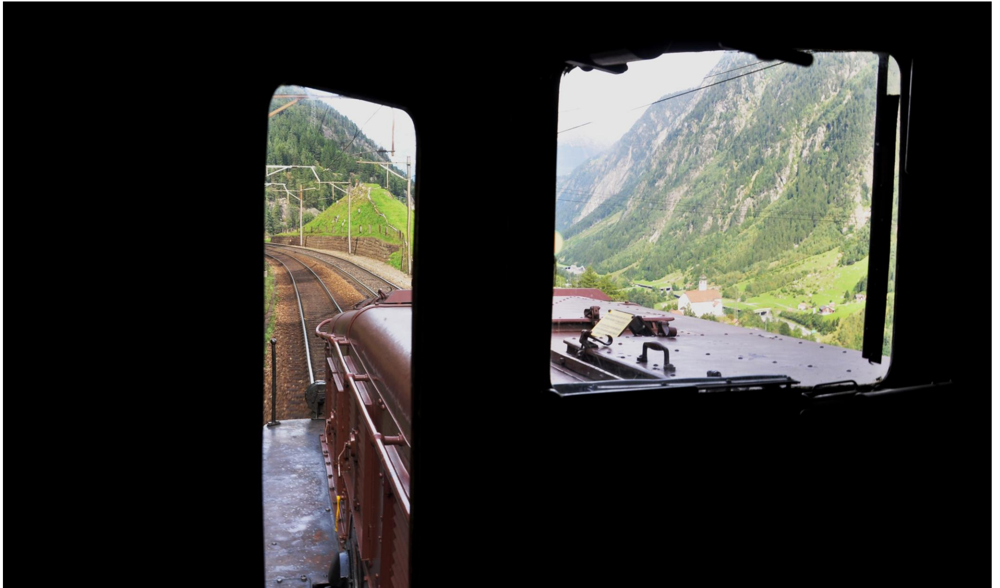
Die Kirche von Wassen aus dem Führerstand des „Krokodils“

1 2 3 4 5 6 7 8 9 10 11 12 13 14 15 16 17 18 19 20 21 22 23 24 25 26 27 28 29 30 31