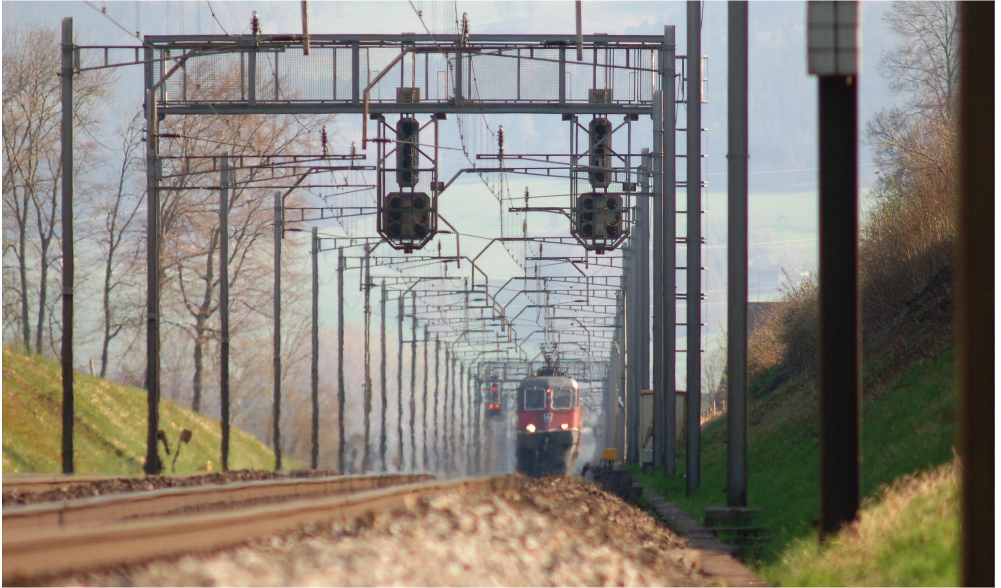
Re 6/6 zwischen Oberrüti und Sins

1 2 3 4 5 6 7 8 9 10 11 12 13 14 15 16 17 18 19 20 21 22 23 24 25 26 27 28 29 30