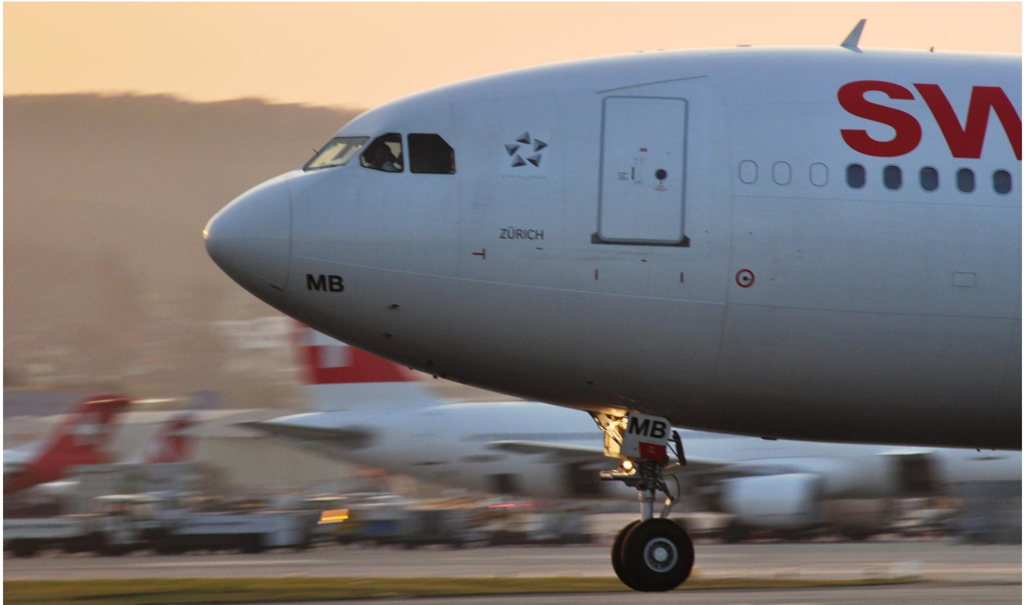
Landung eines A340 der Swiss auf der Piste 34 in Zürich

1 2 3 4 5 6 7 8 9 10 11 12 13 14 15 16 17 18 19 20 21 22 23 24 25 26 27 28 29 30