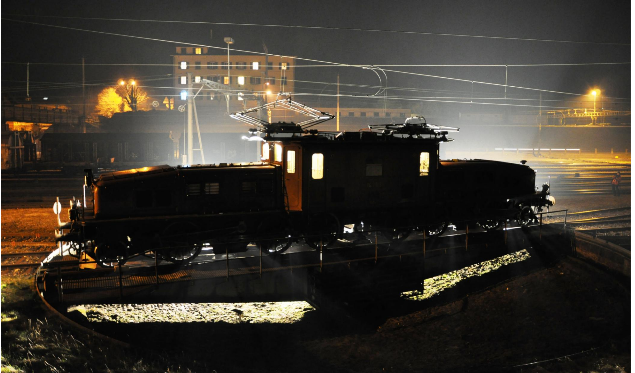
Silhouette der Ce 8/8 II „Krokodil“ auf der Drehbühne in Erstfeld

1 2 3 4 5 6 7 8 9 10 11 12 13 14 15 16 17 18 19 20 21 22 23 24 25 26 27 28 29 30 31