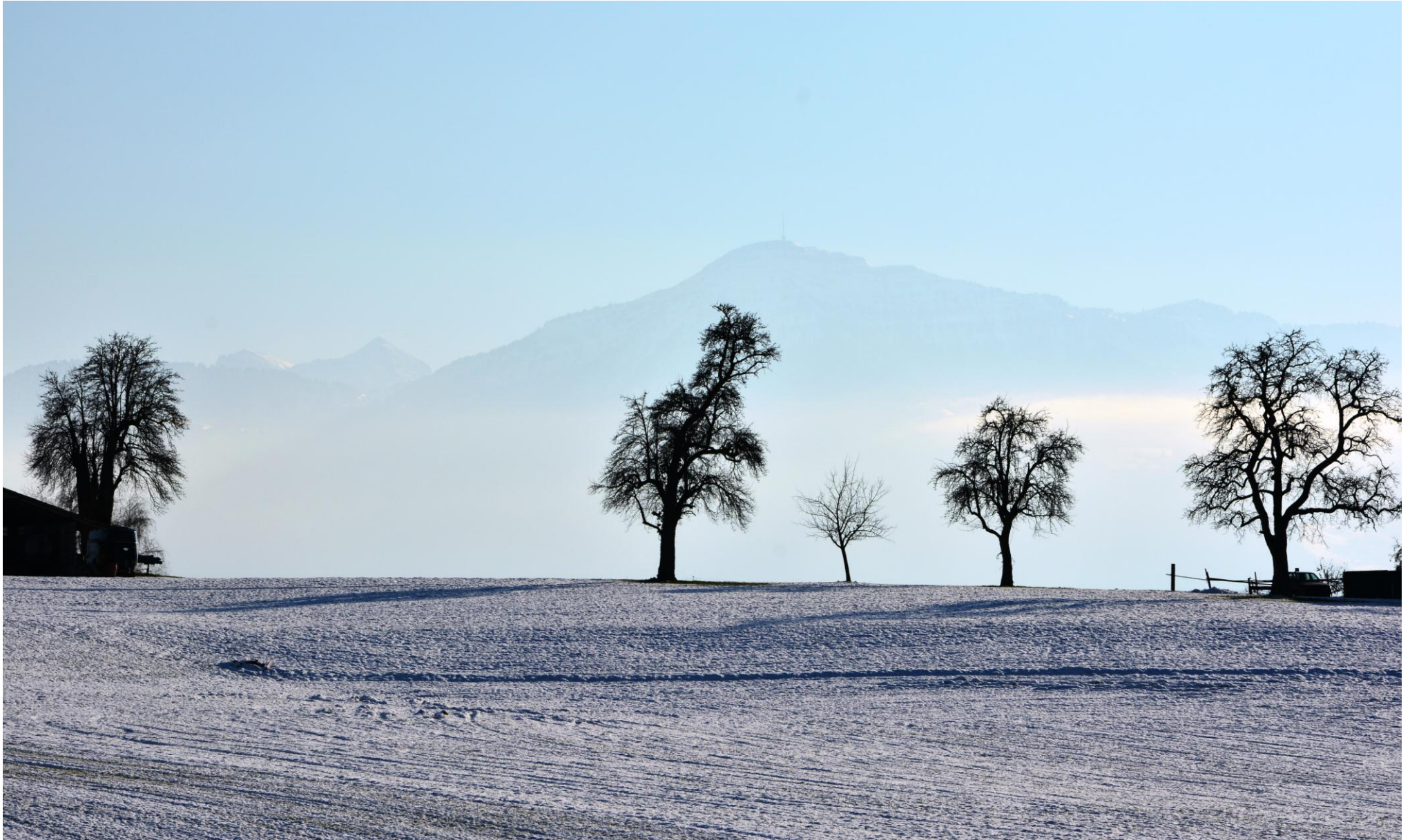
Silhouette von Bäumen in Steinhausen mit der Rigi im Hintergrund

1 2 3 4 5 6 7 8 9 10 11 12 13 14 15 16 17 18 19 20 21 22 23 24 25 26 27 28 29 30 31