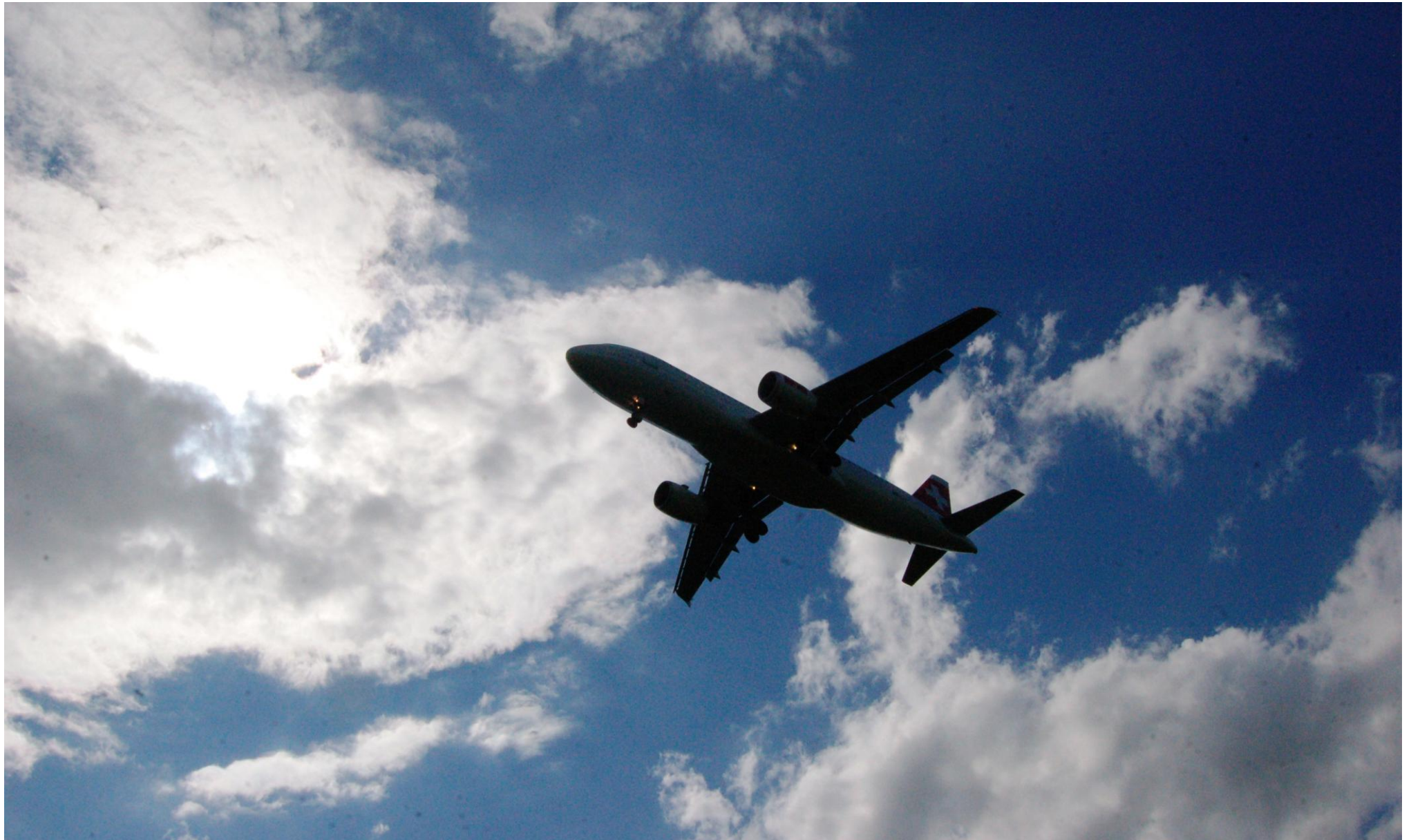
Silhouette Airbus der Swiss vor der Landung in Zürich

1 2 3 4 5 6 7 8 9 10 11 12 13 14 15 16 17 18 19 20 21 22 23 24 25 26 27 28 29 30