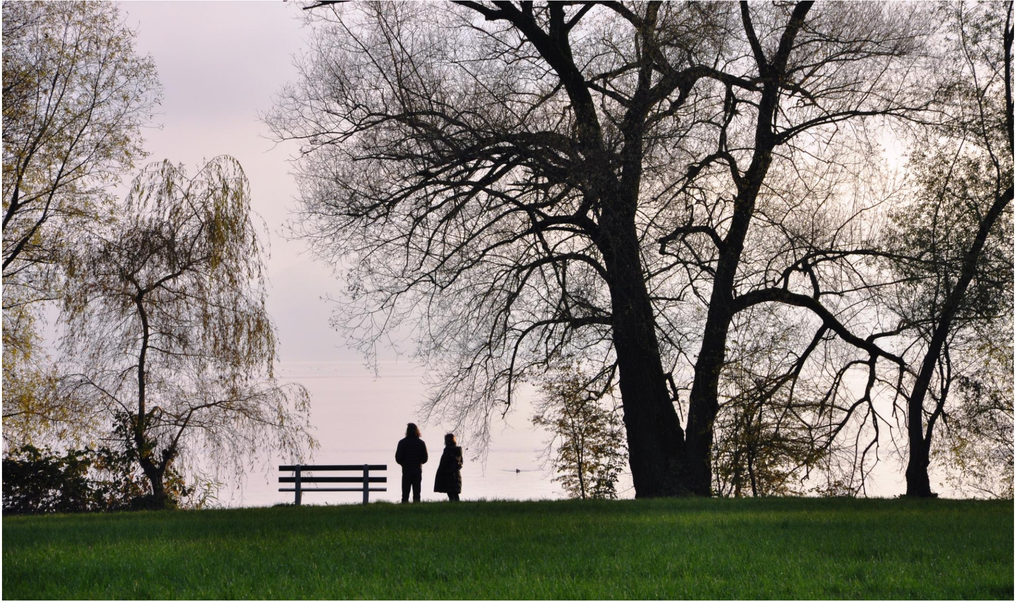
Silhouetten am Zugersee

1 2 3 4 5 6 7 8 9 10 11 12 13 14 15 16 17 18 19 20 21 22 23 24 25 26 27 28 29 30 31