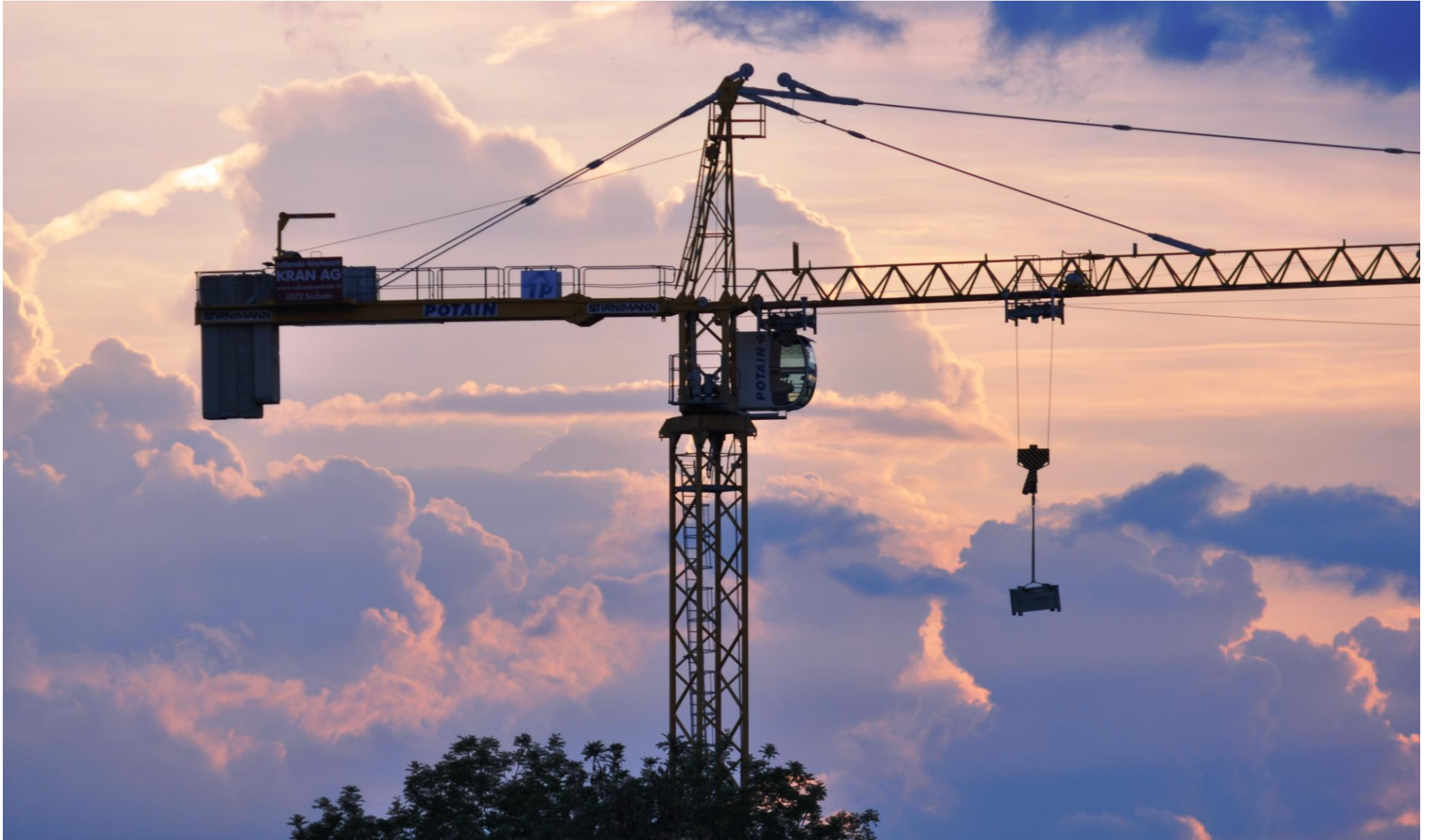
Baukran vor Sommergewitter in Steinhausen

1 2 3 4 5 6 7 8 9 10 11 12 13 14 15 16 17 18 19 20 21 22 23 24 25 26 27 28 29 30 31