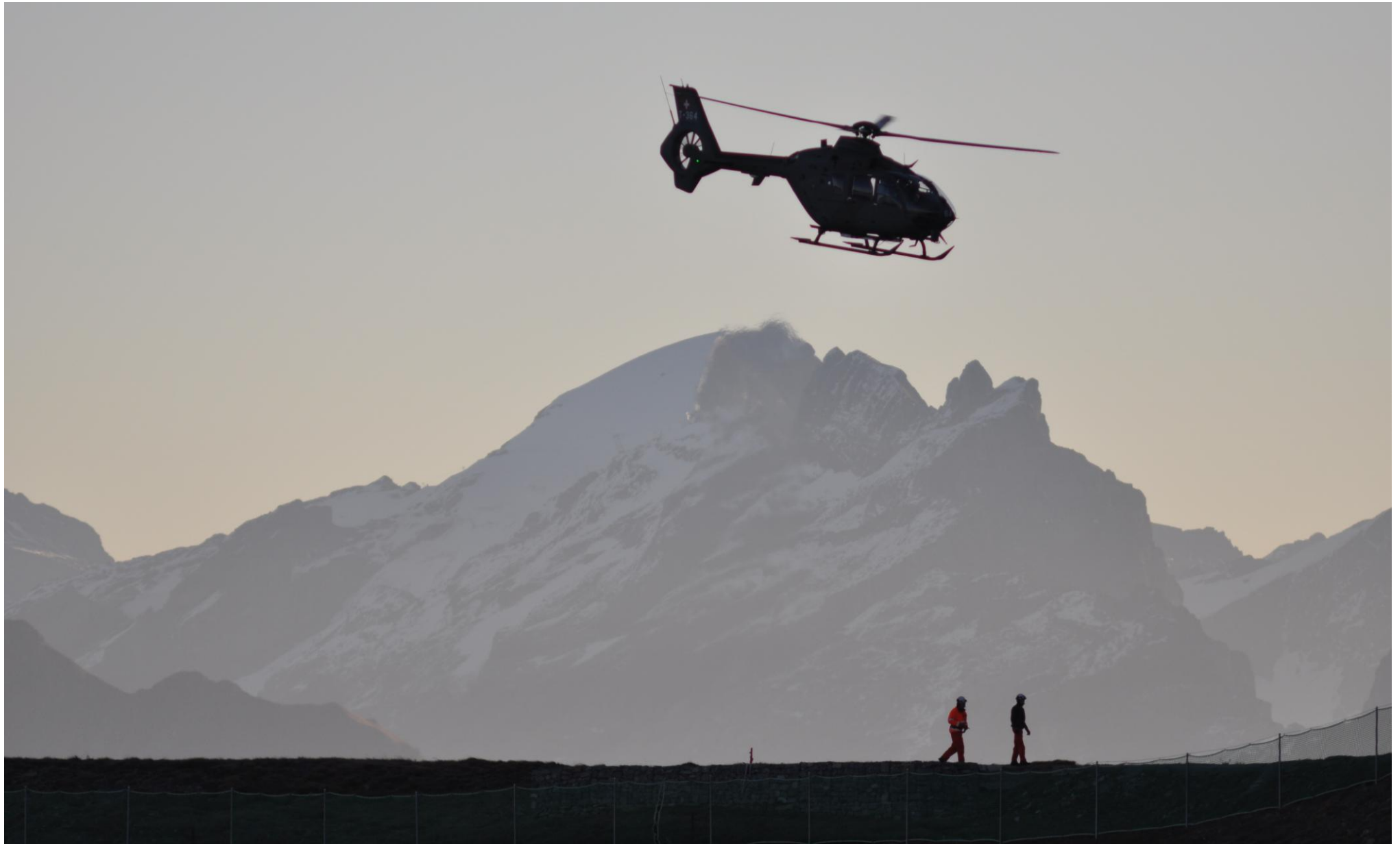
Silhouette des Helikopters EC 635 auf der Axalp

1 2 3 4 5 6 7 8 9 10 11 12 13 14 15 16 17 18 19 20 21 22 23 24 25 26 27 28