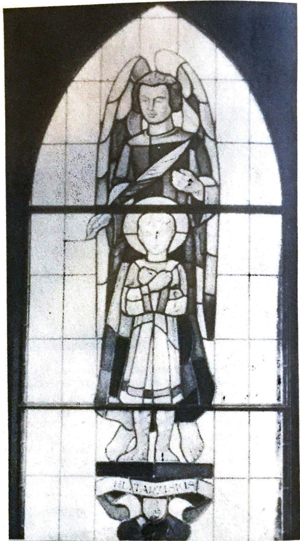
Vitrail (La Villette).

Ce bagage professionnel lui a valu d'être appelé, à Fribourg, à donner des cours de dessin. C'est ainsi qu'il est professeur à l'école normale et à l'école complémentaire professionnelle. Ces activités lui permettent de vivre modestement, comme tous les artistes, et de