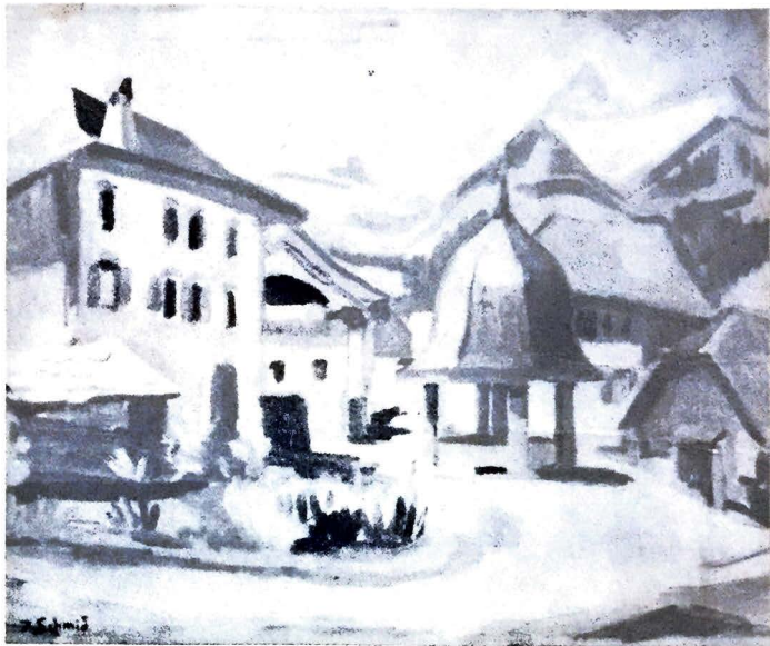
Paysage de Lessoc.