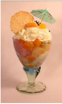
Coupe Föhre Vanille- und Erdbeer- Glacé mit Fruchtsalat und Rahm