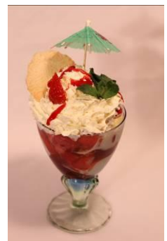
Coupe Romanoff Vanille- Glacé mit frischen Erdbeeren und Rahm ( Saison )