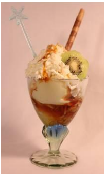
Coupe Alexandra Vanille- Glacé mit Caramelsauce, Mandelsplitter und Rahm