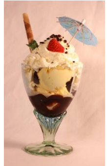
Coupe Dänemark Vanille- Glacé mit Schokoladensauce und Rahm